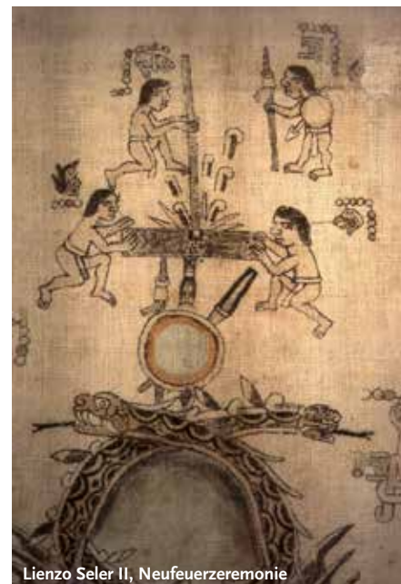
Lienzo Seler II, Neufueherzeremonie

Internationale Konferenz und Workshop: The Coixtlahuaca Valley, Oaxaca, Mexico. Current Research in Archaeology, History, Ethnology and Document Analysis. 25.–26. September 2013 | Ethnologisches Museum, Lansstraße 8, 14195 Berlin