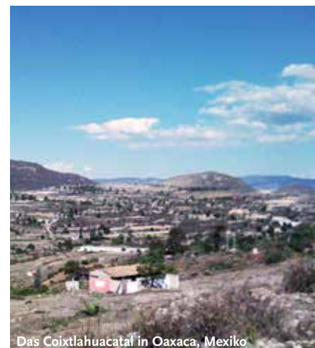
Das Coixtlahuacatal in Oaxaca, Mexiko

Taxonomie Cloud »Research Topics«: http://www.topoi.org/research_topics